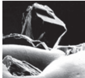
Diamantschleifer: Die Oberflächen von Industriediamanten sind regelmäßiger. Deshalb darf die Körnung ruhig gröber gewählt werden (REM-Aufnahme)