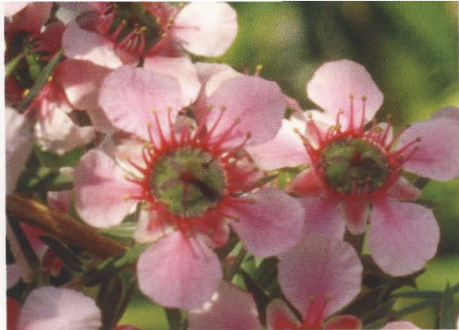
Manuka – Kraft der Natur.