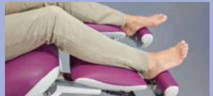
Varianten der Fußteilverstellung