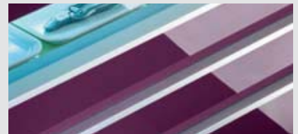
POLYGLOSS SR Oberflächen