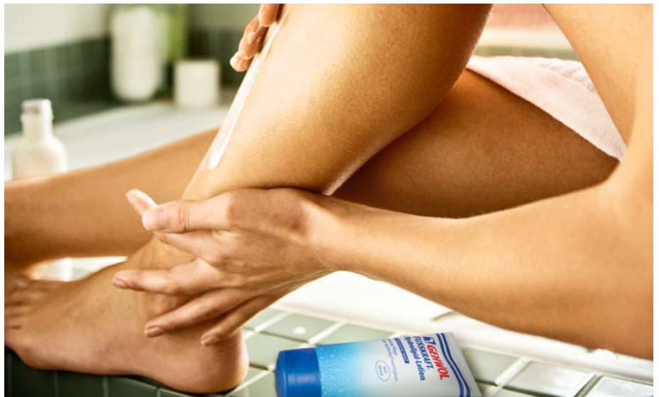
Deutlich weniger Hornhaut. So fühlen sich Füße zart und gepflegt an.

Leiden Diabetiker infolge der Zuckerkrankheit an einer Funktionsstörung der Nerven, verändern sich die Druckverhältnisse am Fuß. An den belasteten Stellen entsteht übermäßige Hornhaut, die mit GEHWOL FUSSKRAFT Hydrolipid-Lotion vermindert werden kann. An der Untersuchung waren zehn Diabetiker beteiligt. Auch bei ihnen nahm die Hornhautdicke nach vier Wochen im gleichen Umfang ab.