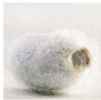
Mit Harnstoff (Urea) und Seidenextrakt.

Intensive Pflege: Harnstoff in hoher Konzentration verstärkt mit Glycerin sowie mit Allantoin lockert den Zellverbund der harten Hornschichten. Klinische Studien* in einem renommierten