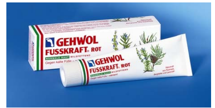
FUSSKRAFT ROT mildfettend