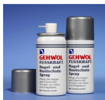
Nagel- & Hautschutz-Spray