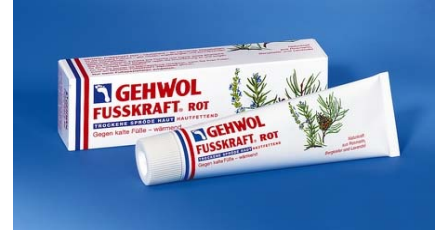
FUSSKRAFT ROT hautfettend